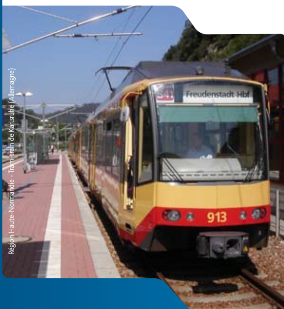
Région Haute-Normandie - Tram-train de Mansigné (Allemagne)