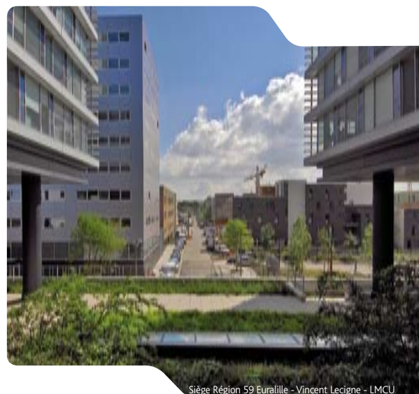
Siège Région 59 Eurallille - Vincent Lecigne - LMCU

L'emploi tertiaire de haut niveau est faiblement représenté à Rouen. Or il contribue fortement au dynamisme des grandes métropoles qui comptent sur le plan national ou européen. Rouen peut, en partie, rattraper son retard de croissance si le projet de la nouvelle gare s'accompagne d'un quartier d'affaires emblématique avec une offre de bureaux de qualité pouvant accueillir des emplois tertiaires de haut niveau.